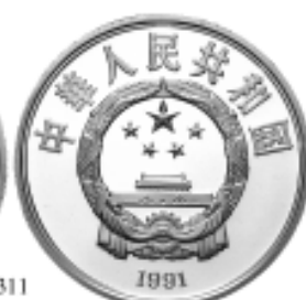
Abb. auf dieser Seite z.T. verkleinert