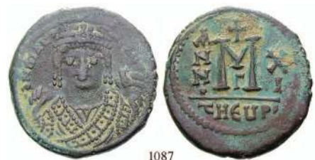
1087 Bro-Follis Jahr 11, Antiochia. Büste von vorn / Wertzeichen M, Offizin G. Sear 533; DOC 163. ss 70,-