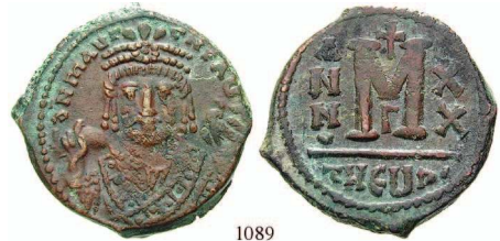
1089 Bro-Follis Jahr 20, Antiochia. Büste von vorn / Wertzeichen M, Offizin G. Sear 533; DOC 172. f.vz 110,-