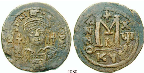
1080 Bro-Follis 544, Kyzikos. Gepanzerte Büste von vorn / Wertzeichen M, Offizin A. Sear 207; DOC 170. ss 65,-