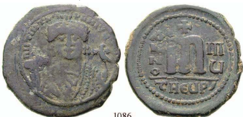
1086 Bro-Follis Jahr 8, Antiochia. Büste von vorn / Wertzeichen m. Sear 532; DOC 159. ss 80,-