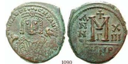
1090 Bro-Follis 594, Antiochia. Büste von vorn / Wertzeichen, Offizin G. Sear 533; DOC 165. f.vz 110,-