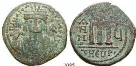
1085 Bro-Follis Jahr 5, Antiochia / Theoupolis. Büste von vorn / Wertzeichen m. Sear 532; DOC 156. ss 70,-