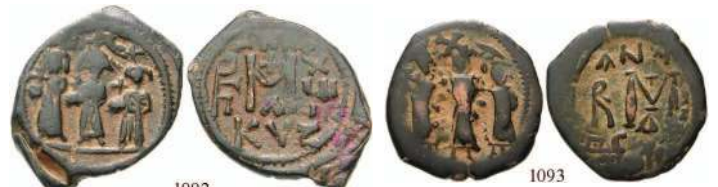
1092 Cu-Follis 23 mm Jahr 18 = 627-628, Kyzikos. Heraclius, Heraclius Constantinus und Martina stehend / Großes Wertzeichen M; darüber ANNO - Kreuz; daneben Kaiser-Stabmonogramm und XUII; darunter KYZ - A. MIB 186; Sear 841. ss 100,-