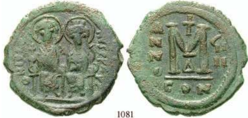
1081 Justin II., 565-578 Cu-Follis 573, Constantinopel. Herrscherpaar / Wertzeichen, Offizin D. Sear 360; DOC 36. ss 65,-