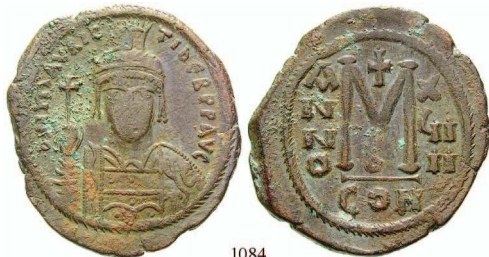
1084 Mauricius Tiberius, 582-602 Bro-Follis Jahr 18, Constantinopel. Büste von vorn / Wertzeichen M, Offizin B. Sear 494; DOC 42. ss+ 95,-