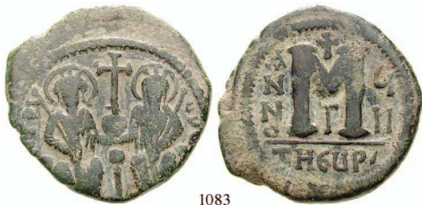
1083 Cu-Follis 571, Antiochia / Theoupolis. Herrscherpaar frontal thronend / Wertzeichen M, Datierung. Sear 379; DOC 152. 40,-