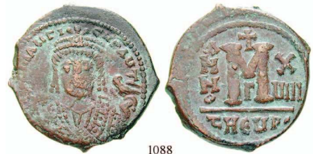
1088 Bro-Follis Jahr 18, Antiochia. Büste von vorn / Wertzeichen M, Offizin G. Sear 533; DOC 170. ss 85,-