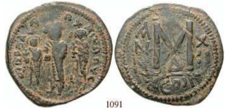
1091 Heraclius u.Heraclius Constantinus, 613-641 Cu-Follis 29 mm Jahr 12 = 621-622), Constantinopel. Heraclius, Heraclius Constantinus und Martina stehend / Großes Wertzeichen M; daneben ANNO (!) - XII; darunter COSM (!) - D. (syrischer Beischlag). MIB 159/161; Sear 805/806. sehr selten, ss 170,- Das interessante Stück kombiniert ein Derivat der Umschrift des Typs MIB 159; Sear 805 mit dem Bild der drei Regenten von MIB 161; Sear 806