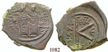
1082 Bro-Halfollis 565, Thessalonike. Herrscherpaar / Wertzeichen. Sear 366; DOC 67. ss 50,-