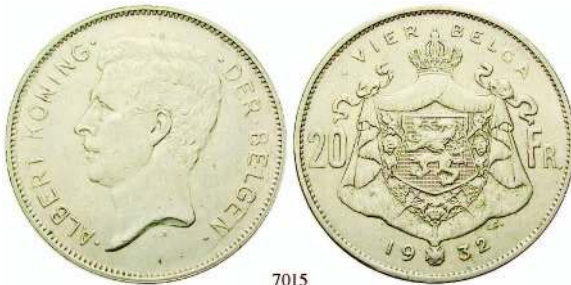
7015 Albert I., 1909-1934 Ni-20 Francs 1932. KM 102. ss+ 65,- 7016 Ni-20 Francs 1932. KM 102. Vs.fleckig, ss 35,- 7017 Ni-5 Francs 1931. flämisch. KM 98. ss 10,- 7018 Ni-5 Francs 1933. französisch. KM 97.1. ss 15,-