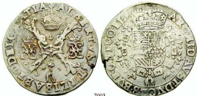
BELGIEN, FLANDERN 7003 Albert und Isabella, 1596-1621 Patagon o.J. Delm.259. ss 125,- 7004 1/4 Patagon o.J. Delm.272. ss 35,-