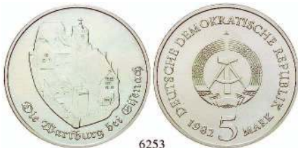
6253 J.1586 5 Mark 1983 Cu-Ni Wartburg st 240,-