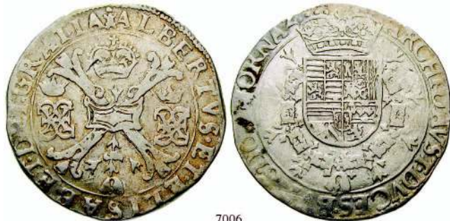
7006 Patagon o.J. Delm.260. f.ss 110,-