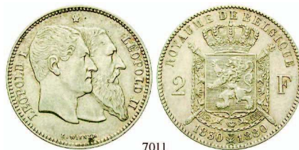
7011 2 Francs 1880. Portrait/Wappen. KM 39. ss+ 120,- 7012 Cu-Centime 1870. KM 33.1. ss 5,- 7013 Cu-Centime 1887. KM 34.1. kl.Flecke, f.st 10,- 7014 Cu-Centime 1894. KM 34.1. vz-st 10,-