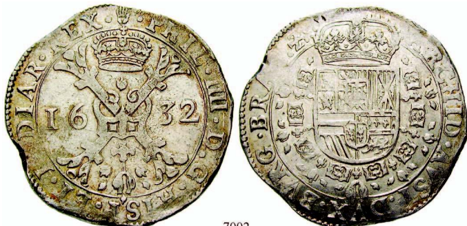
7002 Philipp IV., 1621-1665 Patagon 1632, Antwerpen. Delm.293. ss-vz 180,-