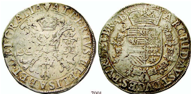
BELGIEN, BRABANT 7001 Albert und Isabella, 1596-1621 Patagon o.J., Antwerpen. Delm.254. ss 125,-