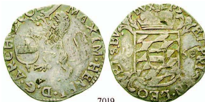
BELGIEN, LÜTTICH, BISTUM 7019 Maximilian Heinrich von Bayern, 1650-1688 Patagon 1658. 4,35 g. Löwe I. mit Schwert und Schild von Bouillon / Schild. Witt.1269var. f.ss 110,-