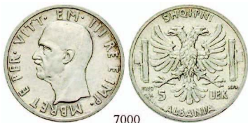
ALBANIEN 7000 Vittorio Emanuele III., 1939-1943 5 Leka 1939. Portrait Vittorio Emanuele III. / Doppeladler flankiert von Likatorenbündeln. KM 33; Schön 33. vz 25,-