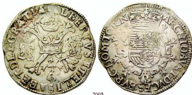
BELGIEN, TOURNAI 7005 Albert und Isabella, 1596-1621 Patagon o.J. Delm.260. ss 130,-